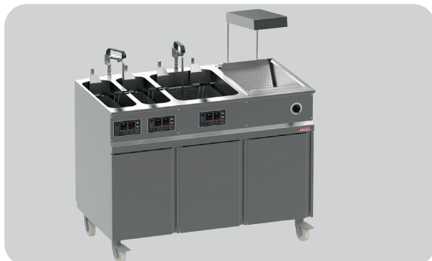
Variante 2: Station Fry&Hold FS500200