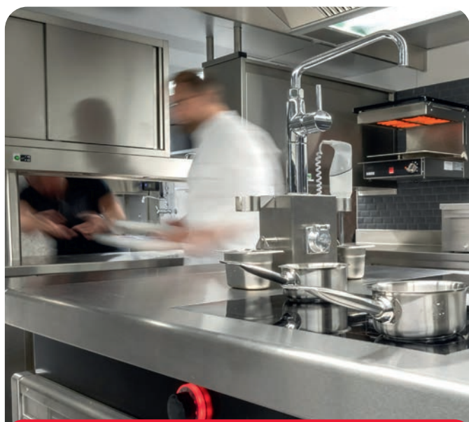
Salamandre murale Salvis Classic Pro près du passe

Un maximum d'économie grâce à une technologie judicieuse.