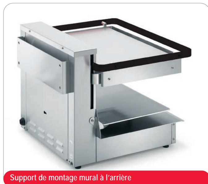
Support de montage mural à l'arrière

Le kit de montage mural peut être commandé en option !