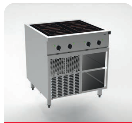
MH200221 - Induction 4 zones multizone