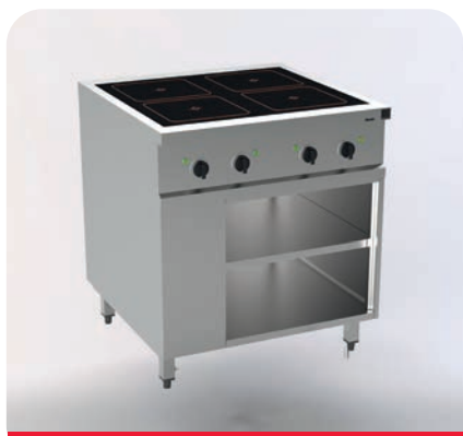
MH200121 - Vitroéramique avec détection de pot

Chaque place dans la cuisine compte. Les casseroles et poêles dans l'élément inférieur sont rapidement rangées.