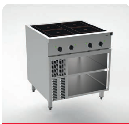
MH200201 - Induction 4x bobines rondes