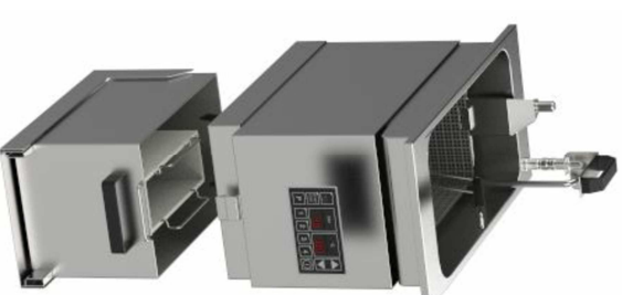
mit Pumpe und Lift