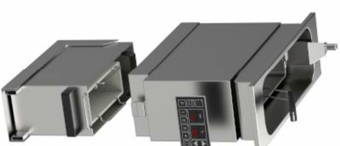
mit Pumpe und Lift