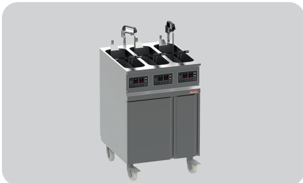
Variante 1: Station Fry Compact FS500100