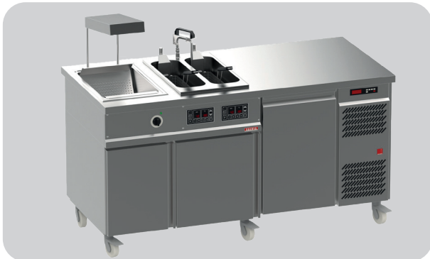
Variante 3: Station Freeze&Fry FS500300