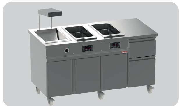
Variante 4: Station Work&Fry FS500400