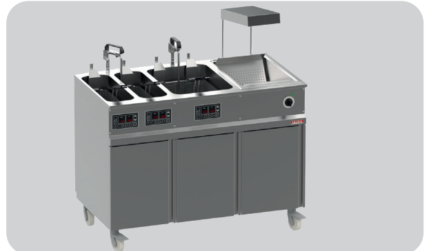
Variante 2: Station Fry&Hold FS500200