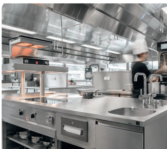
Montage an Herd Aufbau - über Herd /Grill