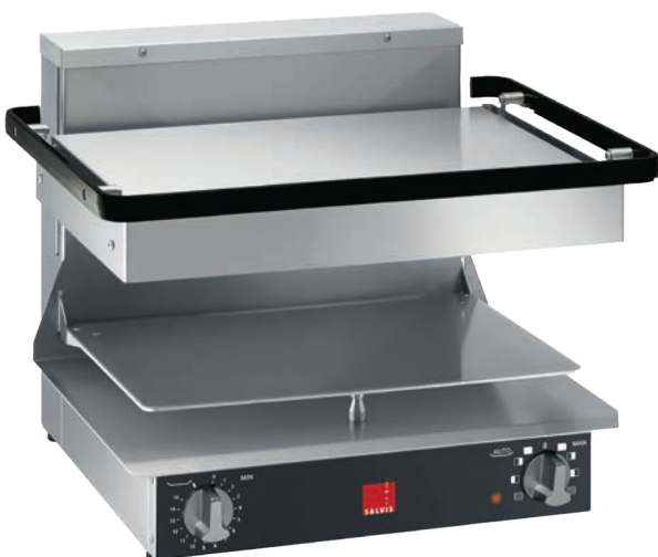
Salamander Salvis Classic

Die hochwertige Verarbeitung, grossen Radien und die klappbare Tellerauflage erleichtern die Reinigung.