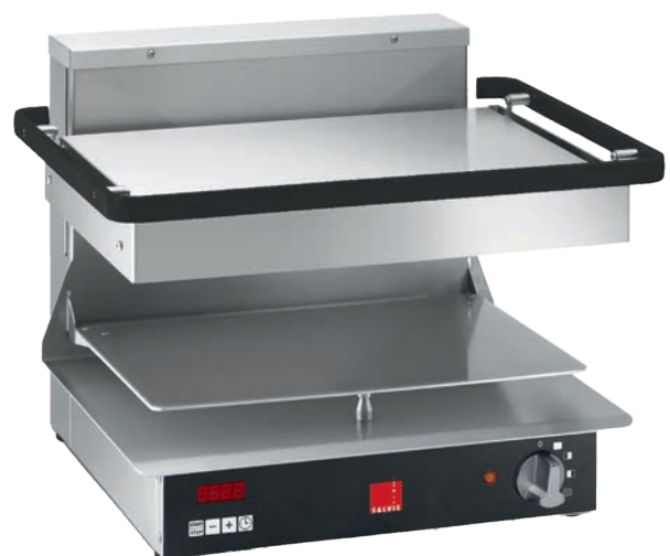
Salamander Salvis Classic Pro