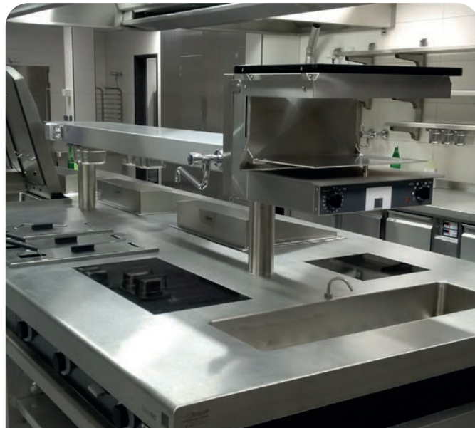
Montage an Herd Aufbau - über Bain Marie