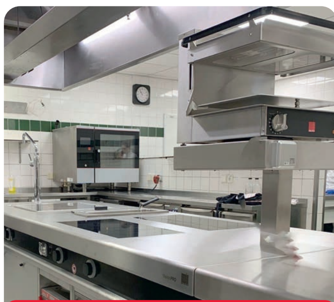
Montage Salamander Classic über Arbeitsfläche